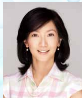
向井 亜紀さん（タレント）

▶ 15:00 ②特別講演 『がんと向き合う』 ～自分の身体と時間を大切に～ 向井 亜紀さん（タレント）