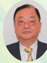
衆議院議員 永山 文雄

黨員、党友の皆さま新年あ けましておめでとうございま す。ついで新年のごあいさつを申し上げます。