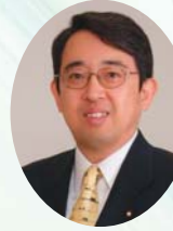
衆議院議員 橋 慶一郎

新年明けましておめでとう ございます。皆様にはご家 族お揃いで清々しい新春をお迎えになったこと と存じます。