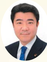
参議院議員 野上 浩太郎