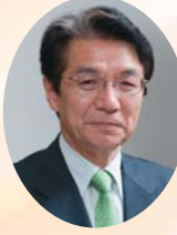
参議院議員 山田 俊男

新しい年をお迎えになり、 ご家族の皆様のご健勝と、お 仕事のますますのご発展をご祈念申し上げます。 さて私は、昨年夏の参議院選挙で皆さんの厚い ご支援により、上位で当選させて頂きました。 ありがとうございます。