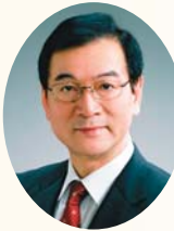
参議院議員 堂故 茂

新年明けましておめでとう ございます。黨員、党友の皆様 方には日頃から大きなご支援、ご協力を賜り、誠 にありがとうございます。