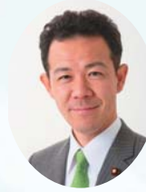
衆議院議員 田畑 裕明

新年明けましておめでとう ございます。黨員、党友の皆様 には常日頃からの厚情に対して謹んで御礼申し 上げます。